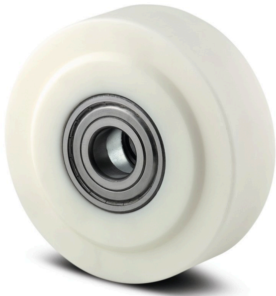
Attēls var atšķirties no oriģinālā produkta