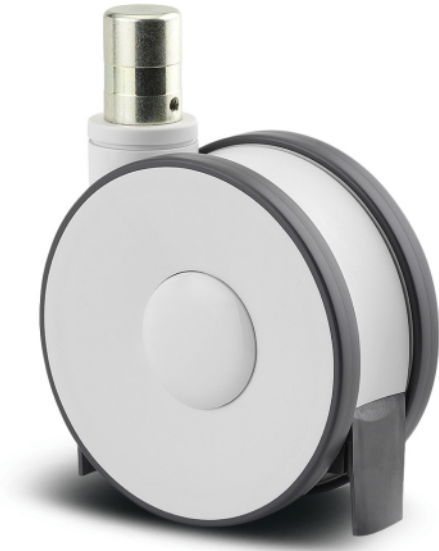
图片可能与原产品不同