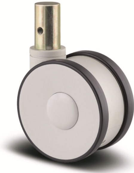
图片可能与原产品不同