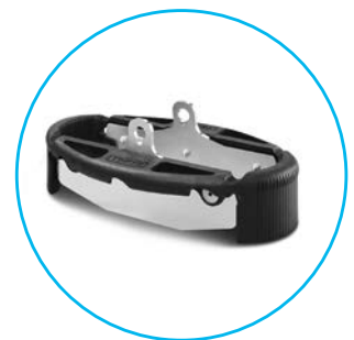
Protección de pies