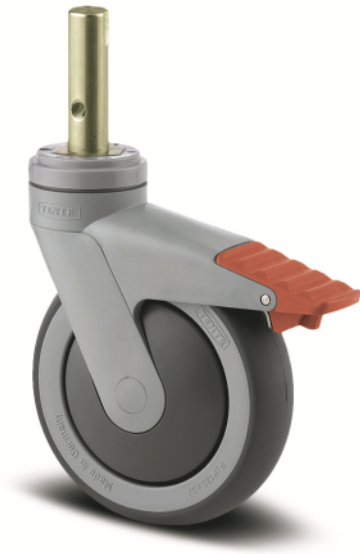
图片可能与原产品不同