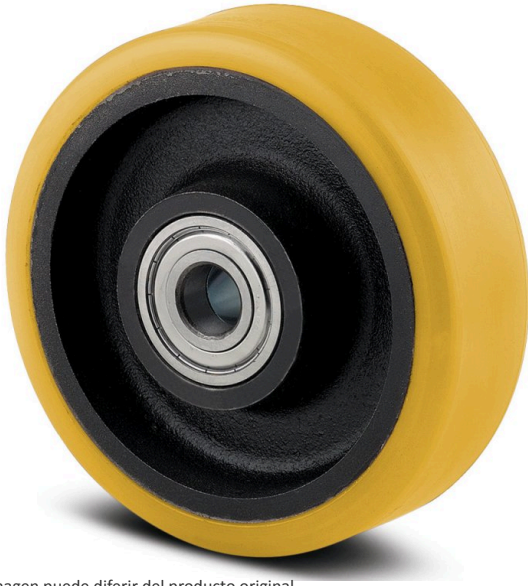
La imagen puede diferir del producto original