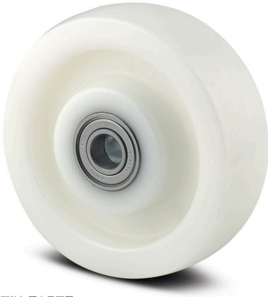
图片可能与原产品不同